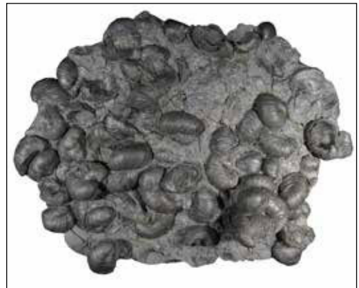
Abb. 19 (oben): Häufige und meist sehr fragile Muschel der Gattung Oxytoma , 1,8 cm. Dieses Exemplar liegt auf einer Tonsteinkonkretion auf und war daher stabil genug, um vollständig geborgen werden zu können. Die Gattung tritt sowohl in der Reynesi-Subzone als auch in der Scipionianum-Subzone auf. Sammlung: S. Simonsen