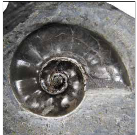
Abb. 3 (oben): Später Vertreter von Coronicerias cf. lyra , 8,2 cm, Scipionianum -Subzone, Oolithbank, Am Finkenbach. Sammlung: S. Simonsen