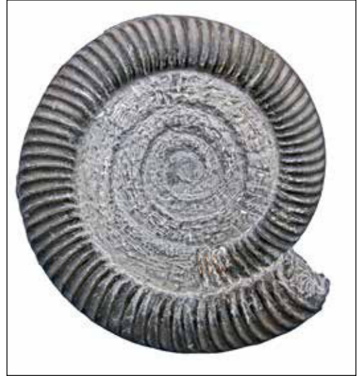
Abb. 14 (unten): Coroniceras lyra , 12 cm, Reynesi-Subzone, Rückhaltebecken. Sammlung: S. Simonsen

Abb. 13 (oben): Große Finderfreude am 21. September 2012: Eine Konkretion mit eingebettetem Coroniceras lyra aus der Reynesi-Subzone. Der Ammonit lag einfach so da – allerdings ziemlich dreckverschmiert, bevor er in einer Pfütze vorge-reinigt und anschließend fotografiert wurde. Das Präparationsergebnis nach Freilegung mit einem Druckluftpräparierstichel zeigt Abb. 14.