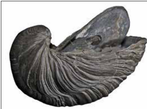
Abb. 17 (oben): Große Coroniceraten waren in den jüngsten im Rückhaltebecken aufgeschlossenen Schichten nicht selten, jedoch ließ die Erhaltungsqualität oft zu wünschen übrig. Es bedarf viel Klebe-, Präparations- und Restaurationsarbeit, um aus diesen Exemplaren taugliche Sammlungstücke zu machen. Sammlung: S. Schubert