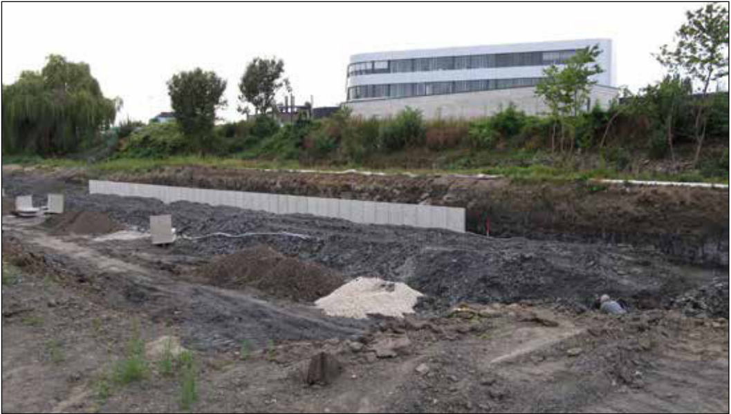
Abb. 1: Das Regenwasserrückhaltebecken nahe der Petristraße (heute gelegen an der Straße Zur Alten Gärtnerei) während der Bauphase Mitte September 2012. Im Hintergrund sieht man die Rückfront des ADAC-Gebäudes an der Eckendorfer Straße.

studieren, während das Anstehende leider durch die schnell fortschreitenden Baumaßnahmen für uns nicht zugänglich war. Eine Hartsteinbank der scipionianum -Subzone im Kanalaushub der Straße Am Finkenbach und einige Lagen der reynesi -Subzone im Regenrückhaltebecken lieferten die interessantesten und am besten erhaltenen Funde. Profilaufnahmen wurden aufgrund der überwiegend einheitlichen Gesteinsbeschaffenheit und der vergleichsweise geringen Fossilführung der Schichten nicht durchgeführt. Die Funde ermöglichen durch den Leitwert der Ammoniten dennoch eine exakte Zuordnung, die auch durch vergleichende Beobachtung mit anderen Baumaßnahmen der letzten Jahrzehnte im Bielefelder Stadtgebiet Bestätigung findet. Zudem lässt sich sogar ein „weißer Fleck“ auf der geologischen Karte von Bielefeld tilgen. Für den Bereich des Rückhaltebeckens wurden hier rezente Talablagerungen kartiert. Tatsächlich befindet sich jedoch schon in wenigen Metern Tiefe der Untere Jura mit Schichten des Unteren Sinemuriums. Diese