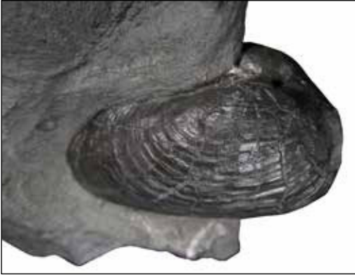
Abb. 11: Pholadomya sp., 5,3 cm, Oolithbank, Scipionianum-Subzone, Am Finkenbach. Sammlung: S. Simonsen