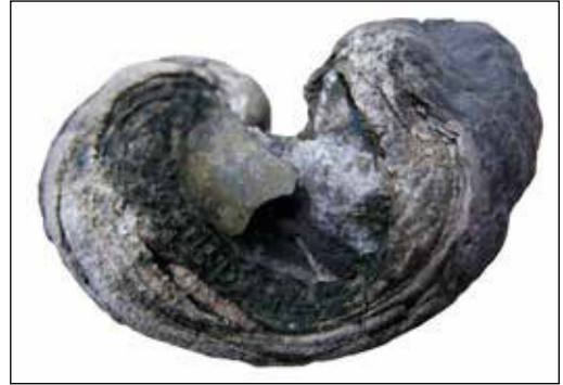
Abb. 12: Gryphaea kam sowohl in der Scipionianum-Subzone der Oolithbank als auch massenhaft in der Reynesi-Subzone des Regenrückhaltebeckens vor. Dieses 3,5 cm breite Exemplar offenbart Dolomit, Kalzit und ein ca. 1 cm großes Zinkblendeaggregat. Sammlung: S. Schubert