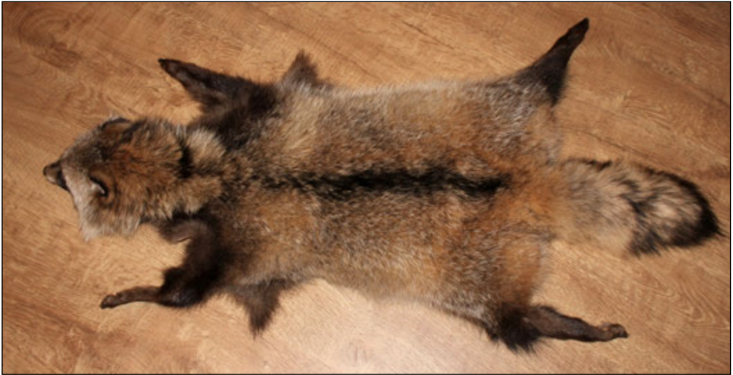
Abb. 1: Fell eines am 30.10.2009 in Harsewinkel geschossenen jungen Rüden des Marderhundes