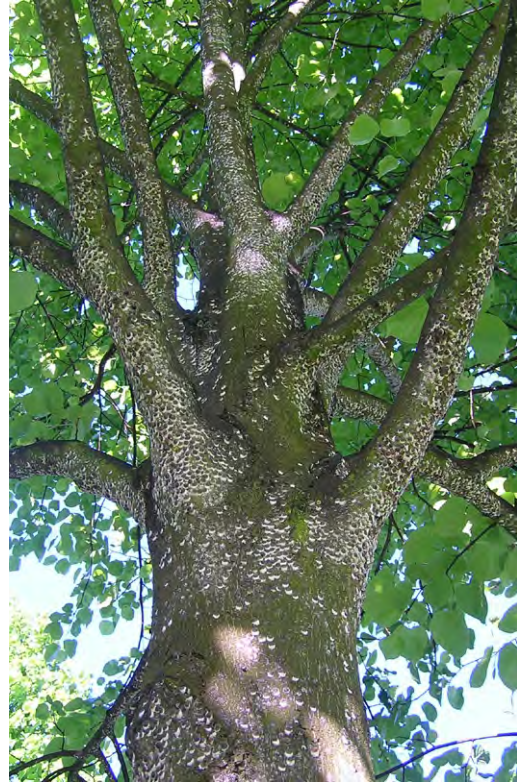
Abb. 5: Stamm und breitere Äste dieser Linde sind dicht besetzt mit der Wolligen Napfschildlaus ( Pulvinaria regalis ), vgl. Abb. 1; Juni 2009, Hannover-Herrenhausen

ebenso wie bei der Wolligen Napfschildlaus erfolgen.