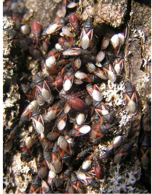
Abb. 3, 4: Ansammlungen von Lindenwanzen (Friedhof in Bielefeld-Heepen, 26.1.2020)

Beobachtungen mitteilen, die sie jetzt als Art und von ihrer Bedeutung her einordnen konnten.