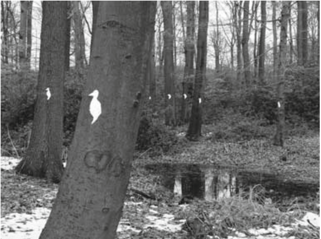
Abb. 4: Strothbachwald im März 2010 mit Stechpalmen und gekennzeichneten Biotopbäumen.

Der Waldgesellschaft des Fago-Quercetum petraeae (auch Violo-Quercetum oder Lonicero periclymeni-Fagetum) entspricht die aktuelle Vegetation sehr weitgehend: Die Baumschicht wird von Rotbuche, Stiel- und Traubeneiche gebildet, hinzu treten in der zweiten Kronenschicht Sandbirke, Hainbuche, Schwarzerle, Eberesche und Stechpalme, in der Strauchschicht neben der häufigen Stechpalme und den ebenfalls verbreiteten Himbeeren und Brombeeren auch Faulbaum, Späte Traubenkirsche, Roter und Schwarzer Holun-