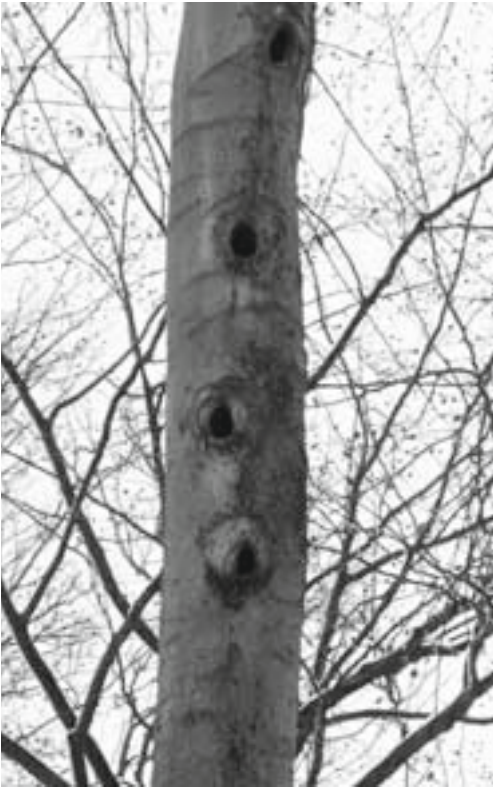
Abb. 5: „Sozialer Wohnungsbau“ im Strothbachwald: Von der Bautätigkeit des Schwarzspechts profitieren u.a. Dohlen, Hohltauben, Stare, Kleiber und Fledermäuse.

Darüber hinaus wurden im Strothbachwald weitere 182 Biotopbäume ermittelt und gekennzeichnet, die sich durch zusätzliche Spalten, Rinden- und Stammschäden, Astausbrüche und Faulstellen, Totholz und Pilzbewuchs sowie Vogelhorste auszeichnen und damit essentielle Lebensraumelemente für eine Vielzahl von Arten darstellen. Gerade die Kombination von zahlreichen Höhlenquartieren als Brut- und Winterquartier, dem reichen Nahrungsangebot im Altholz und den walddahen Wasserflächen ergeben einen heute seltenen Faktorenkomplex, der beispielsweise für den Kleinen Abendsegler unverzichtbar zu sein scheint (s. unten).