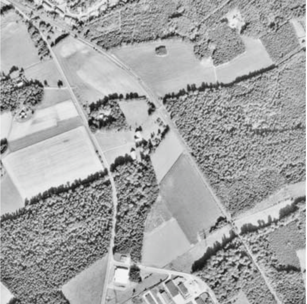
Abb. 2: Die Luftbildkarte 1985 (Bildflug 1984) verdeutlicht den weiteren Waldverlust und die beginnende Trennung des Strothbachwaldes vom Evessellbruch, die bereits durch erste Rodungen Ende des 19. Jahrhunderts einsetzte, zeigt aber auch die großkronige Altersstruktur seines Bestandes, die im Umkreis ähnlich nur noch das Waldstück südlich des Hofes Rolf aufweist.