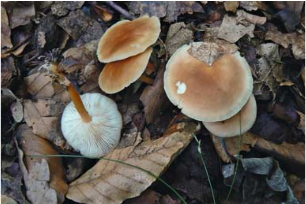
Abb. 8 (oben): Stäubender Zwitterling ( Nyctalis asterophora ) auf altem Schwärztäubling Abb. 9 (unten): Waldfreund-Rübling ( Gymnopus dryophilus )