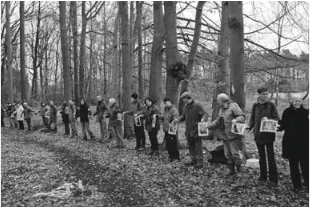
Abb. 18: Mit Bildern der Höhlenbesiedler protestiert die Menschenkette (Ausschnitt) gegen die Vernichtung ihres Lebensraumes.