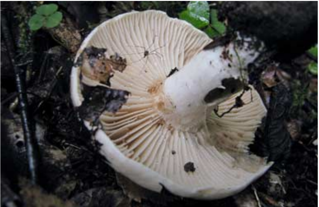
Abb. 6 (oben): Olivbrauner Milchling ( Lactarius turpis )