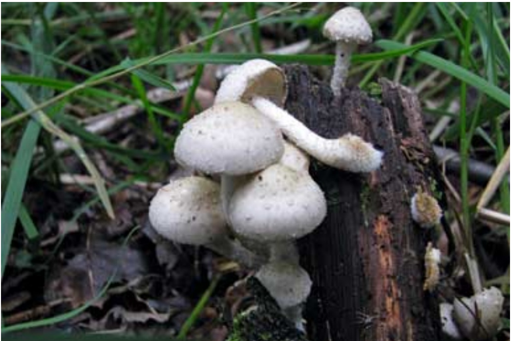
Abb. 10 (oben): Echter Zunderschwamm ( Fomes fomentarius ) Abb. 11 (unten): Strohblasser Schüppling ( Pholiota gummosa )