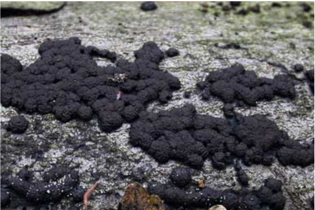
Abb. 12 (oben): Herber Zwergknäueling ( Panellus stipticus )