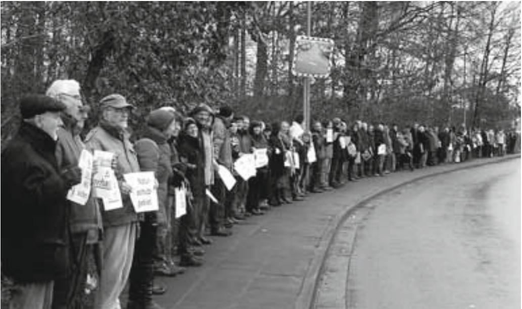
Abb. 20: Natur macht keine Kompromisse: 100 Demonstranten formulieren Klartext.