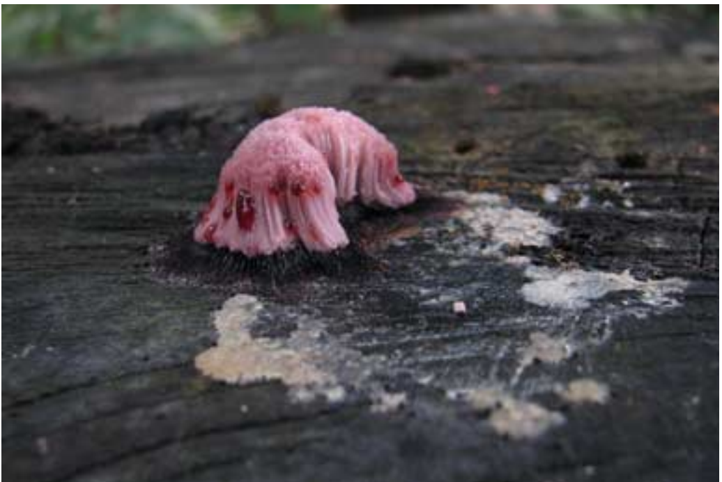
Abb. 14 (oben): Ablösender Rindenpilz ( Cylindrobasidium laeve ) Abb. 15 (unten): Ein Schleimpilz ( Stemonitis cf. axifera )