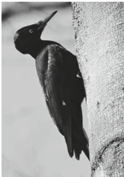
Abb. 16: Der Strothbachwald ist die angestammte Heimat ungezählter Schwarzspecht-Generationen (im Bild ein Weibchen am Originalschauplatz).

Am Beispiel des Schwarzspechtes soll dargestellt werden, welche Bedeutung dem Vorkommen einer planungsrelevanten Art nach dem aktuellen Artenschutzrecht zu-