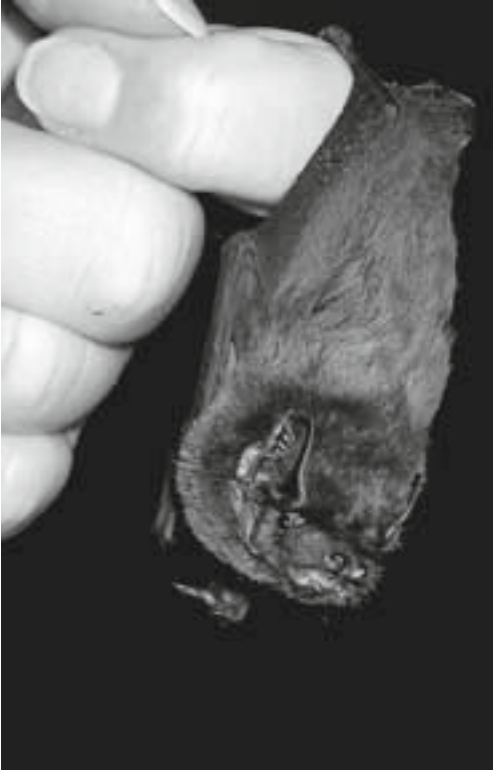
Abb. 17: In unserer Hand: Wir Menschen entscheiden über das Schicksal des Kleinen Abendseglers.