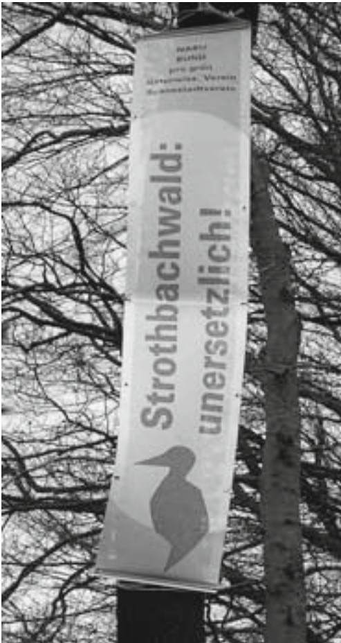
Abb. 19: Unmissverständlich: Dieser Wald muss geschützt werden!

Speditionsfirma, Stadtrat, Oberbürgermeister und Verwaltung der Stadt Bielefeld wurden erneut aufgefordert, die Hängepartie um den Strothbachwald unverzüglich zu beenden, den ökologisch und kulturgeschichtlich höchst wertvollen Wald endlich wirksam unter Schutz zu stellen und auf Dauer zu erhalten. Den Bürgerwillen verdeutlichten Transparente, die hoch in den Bäumen aufgehängt wurden. In der Tat scheint es nun an der Zeit, auch in Bielefeld stärker darauf zu hören, wie die Bürgerinnen und Bürger die Zukunft ihrer Stadt gestalten möchten. Die Zeit politi-