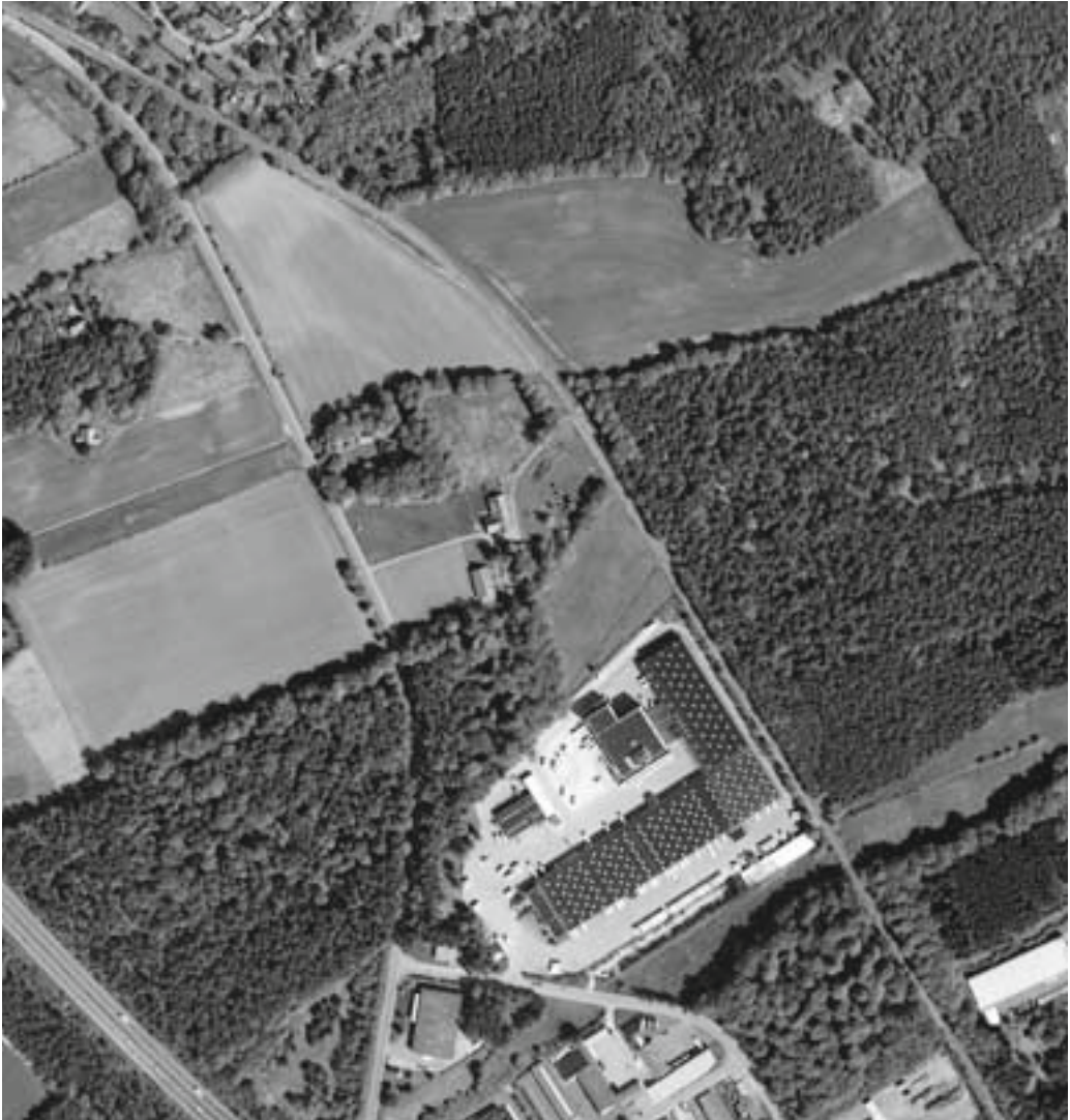
Abb. 3: Im aktuellen Luftbild von 2008 wird der Strothbachwald bereits auf 3 Seiten durch Bebauung eingekreist, die Grünbrücke Evessel durch die Spedition Wahl & Co. radikal unterbrochen.